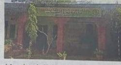
सोनीपत, मोहाना में छोटे से भवन में चल रहा गर्ल्स कॉलेज।