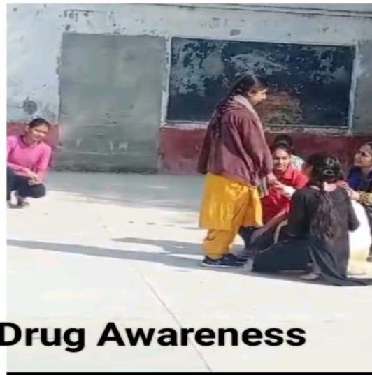
Nukkad Natak on Drug Awareness